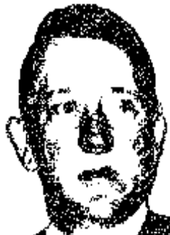
Négor Grouchka, en 1978, peu avant d'être démissionné du ministère de l'information.