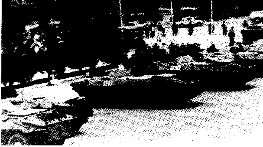
n groupe de chars mordoriens, prêts à démarrer, hier en fin d'après-midi, dans la ville de Deepo.

La Mordorie n'aura pas attendu longtemps avant de prendre position dans le conflit qui Gondorie. Géorj Coorend, le Président de la République Mordorienne, a annoncé hier u actif à Jicolae Karnescu dans sa lutte contre la décadence en Gondorie.