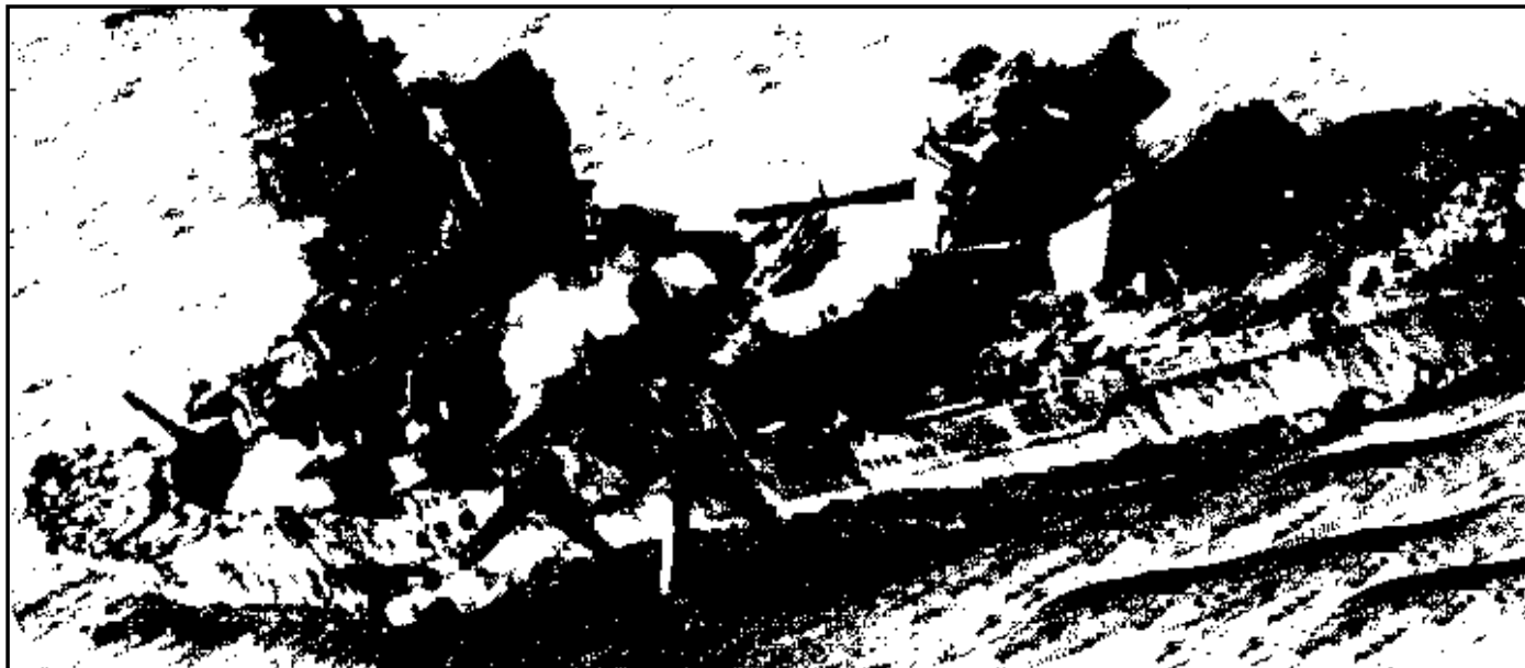
A gauche : le porte-avions mordorien Mérombec, commandé par le contre-amiral Régis Chiarmaro, sombre après avoir été touché par un missile EXOTIK. Ci-dessous : le cuirassé gondorien Enomide, à bord duquel l'amiral Dren-Videgnou a dirigé l'excellente défense du port de Minas Morgul. Ci-dessus : le "Guide de la Révolution", ex-"Conductore" après avoir subi les assauts des avions GIM 22 du Mérombec.