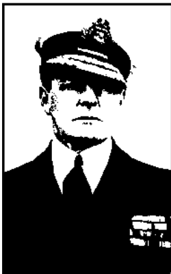
L'amiral gondorien Dren-Videgnou qui, en brisant le blocus mordorien, a protégé le port de Minas Morgul.

Les flottes gondoriennes et mordoriennes se sont affrontées hier 21 février au large des bouches du Graaln, au sud de Minas Morgul. En jetant ses navires dans une bataille terriblement meurtrière, l'amiral gondorien Dren-Videgnou a réussi à protéger Minas Morgul, mais au prix de la perte de plusieurs bâtiments, dont "l'Enomide" et le "Guide de la Révolution".